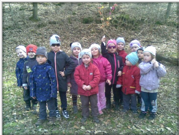
Mateřská škola – foto z vycházky