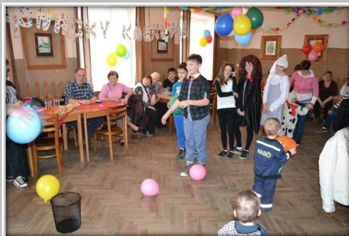
Dětský karneval – soutěž s balóňky