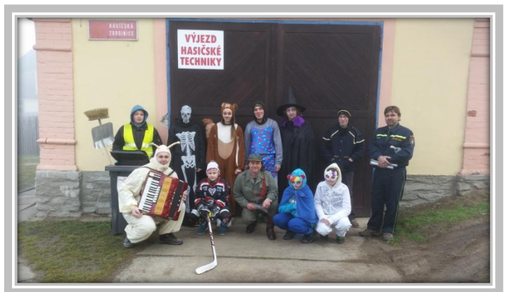
Masopust – společné foto masek

Více fotografií si můžete prohlédnout na obecním webu: www.obec-lesna.eu