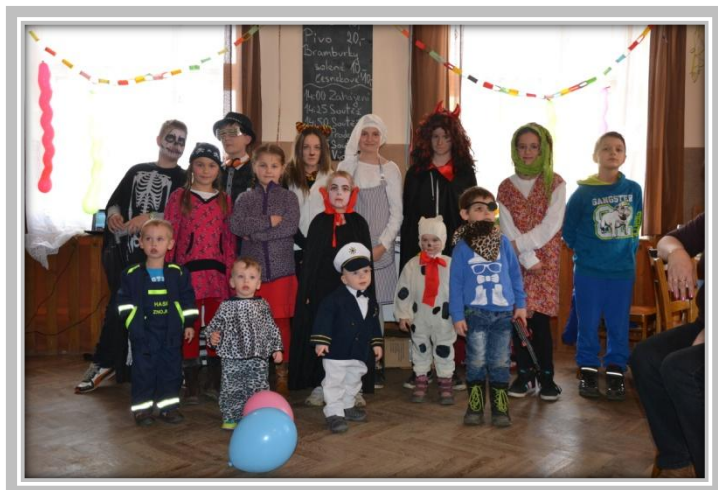
Dětský karneval – společné foto masek