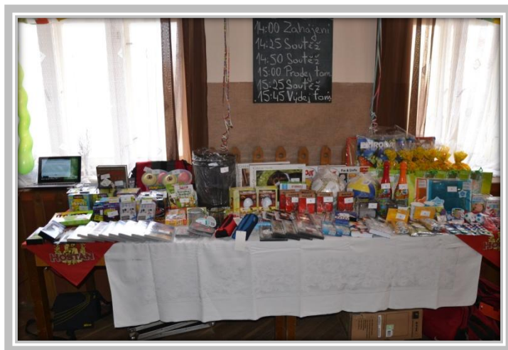
Dětský karneval - vystavená tombola