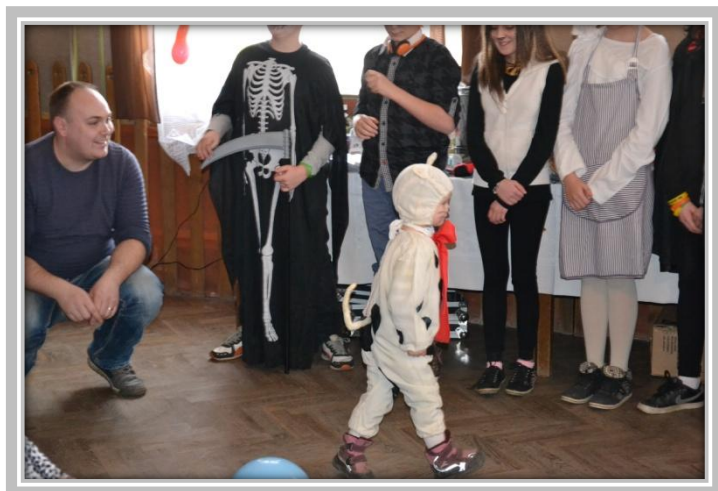
Dětský karneval – představení masek