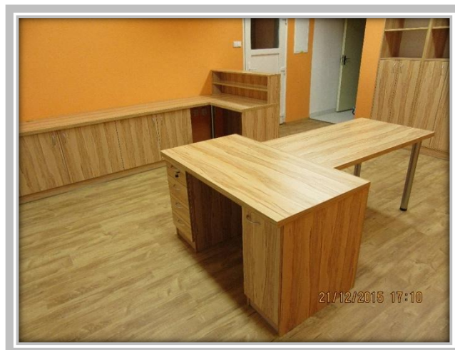
Nový interiér obecního úřadu

Od 1. ledna letošního roku po několika měsících opět sídlíme v budově obecního úřadu. Byla provedena výměna stropu vč. potřebných izolací, dále byla provedena nová elektroinstalace a nová otopná soustava. Výraznou změnou je i nový kancelářský nábytek. Tento projekt byl spolufinancován