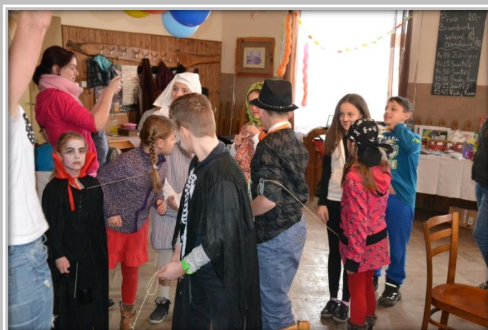
Dětský karneval – soutěž se šňůrkou