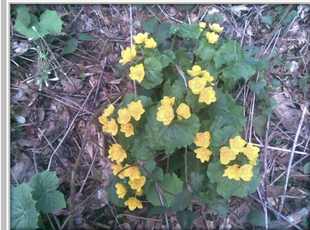
Mateřská škola – foto z vycházky